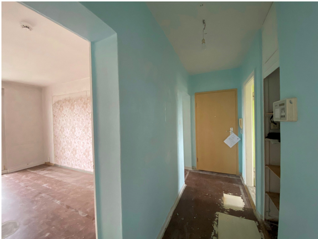
Flur Ansicht 1