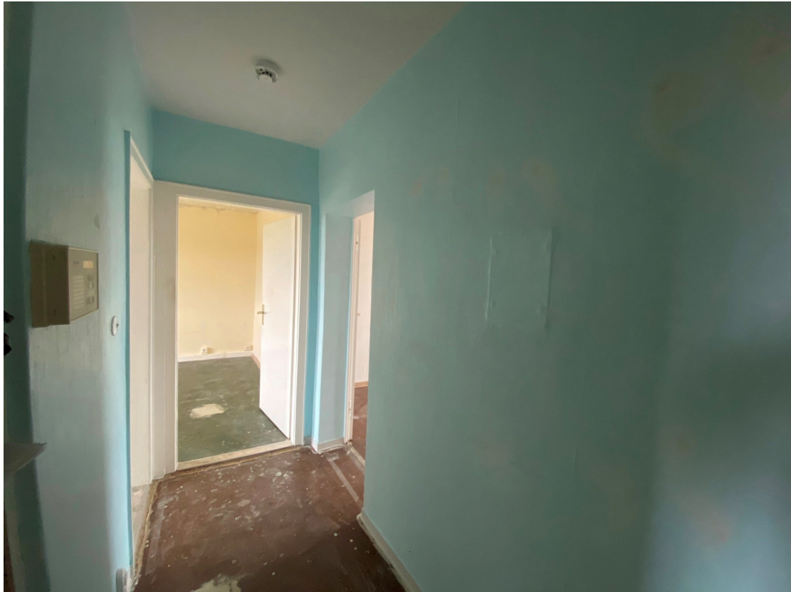
Flur Ansicht 2