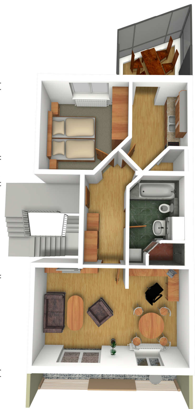
Wohnflächen [m 2 ]